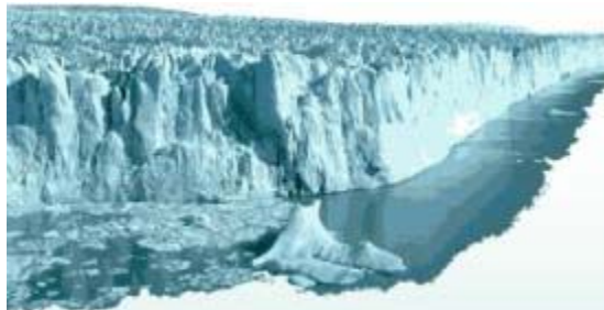
Glaciar Perito Moreno, Patagonia