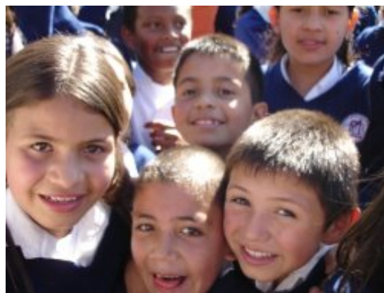
Niños bogotanos beneficiados con el aporte de las cooperativas colombianas