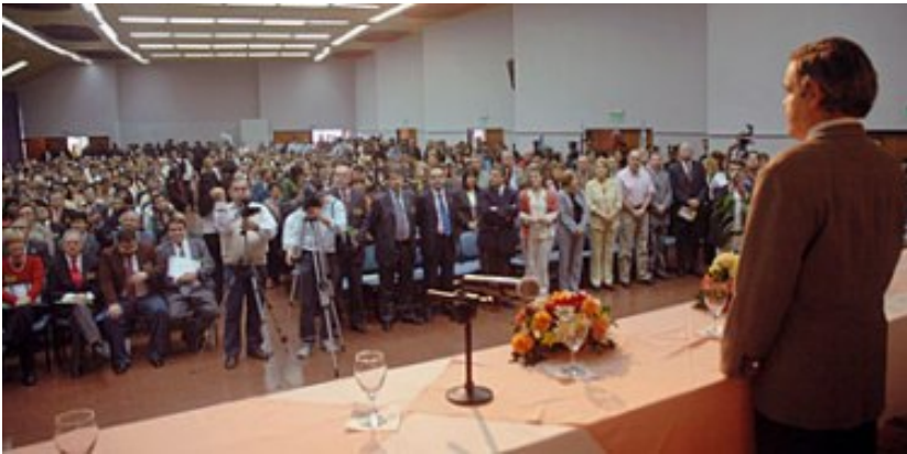
Apertura del III Congreso del Mercosur