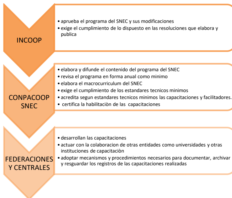
Figura N° 1: Estructura organizacional del SNEC según lo establece la Resolución INCOOP N° 15.637/2016