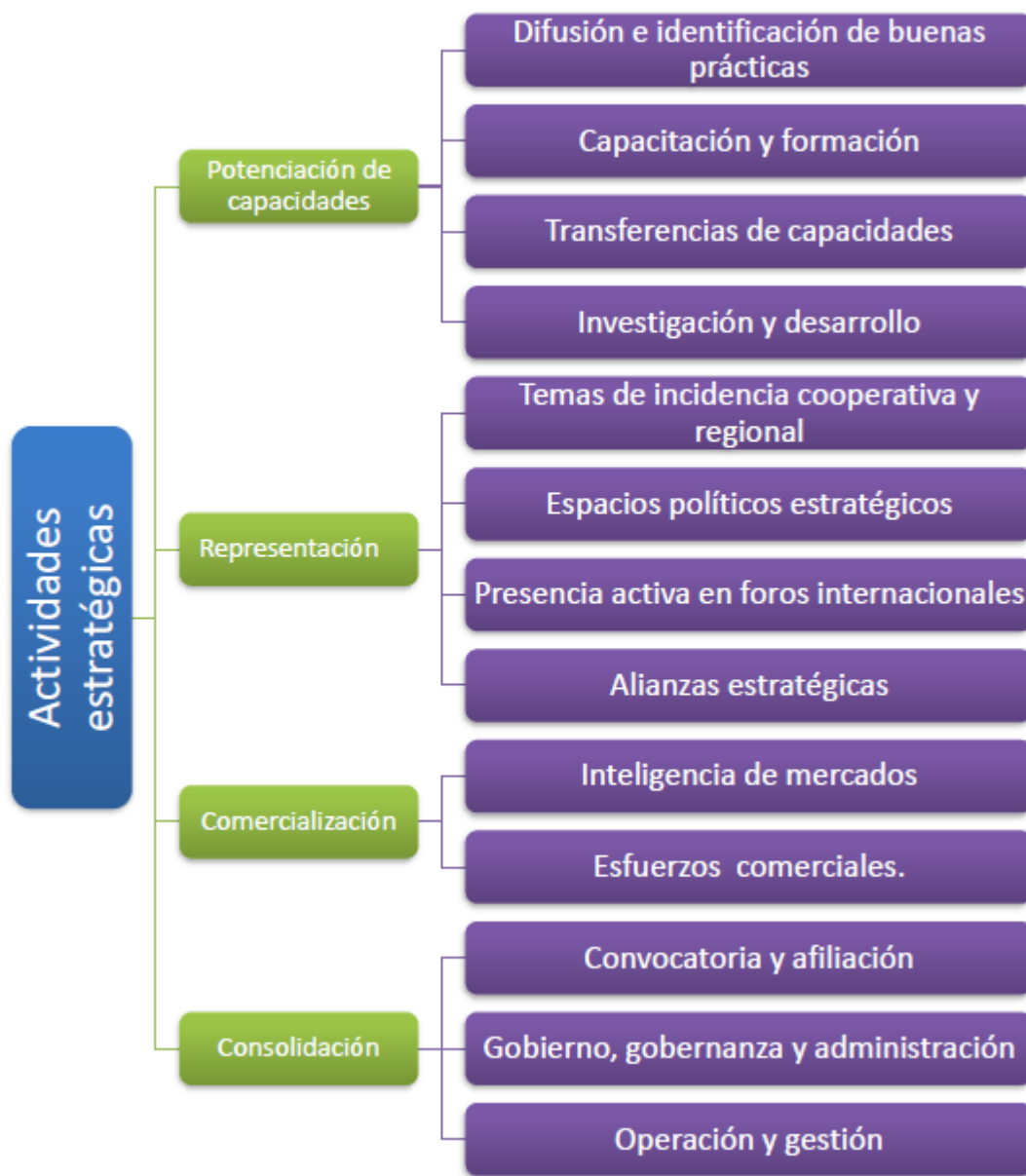
Ilustración 6: Actividades estratégicas