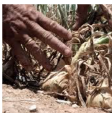
Ilustración 1: Amenazas y oportunidades a las que está expuesto el sector agro-cooperativo de América