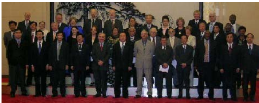
Miembros del Board, personal de la ACI y oficiales de ACFSMC en el Gran Salón de la Gente

Para mayor información visite el Weekly Digest N° 12